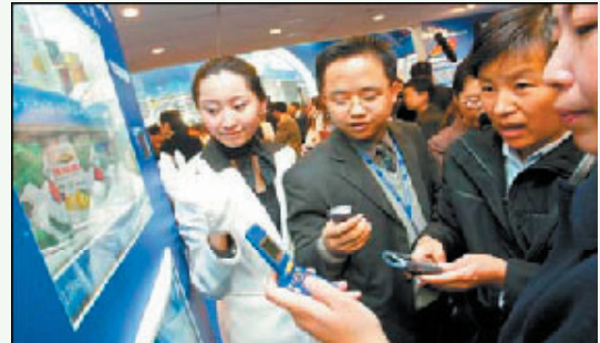
(聯動優勢社のHPのニュース記事から)

上海移動のマーケティング専門家の話によると、今後、中国携帯電話市場において、収入が期待されるサービスは主に2つ。1つはケータイによるモバイル放送サービス(手機電視)であり、もう1つが、決済・金融サービス(手機錢包)である。前者は、通信事業者が放送分野に進出するものであり、後者は金融分野への進出だ。日本と同じく、携帯キャリアは音声サービスでの収益性維持は厳しい収益拡大のための業際分野への進出の例として、今回と次回で「手機錢包」について紹介する。